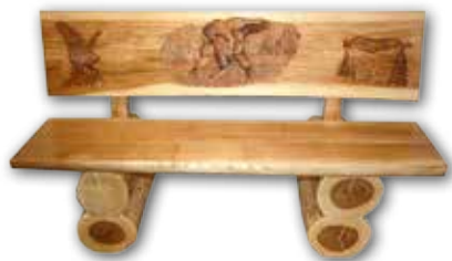
Bank «Trümeli» 140cm, inkl. 1 Bild & Schrift verschiedene Motive 1200.-

Weitere Produkte finden Sie unter: www.egli-holzbildhauerei.ch