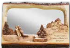
Spiegel inkl. 1 Bild & Schrift verschiedene Motive 650.- bis 1000.-