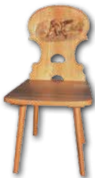
Stabelle inkl. 1 Bild & Schrift verschiedene Motive 550.-